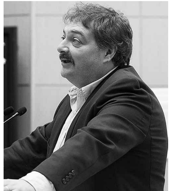
Дмитрий Львович Быков (род. 1967) — русский писатель, поэт, журналист, литературный критик, радио- и телеведущий. Биограф Бориса Пастернака, Булата Окуджавы, Максима Горького и Владимира Маяковского. Преподаёт в московских средних школах «Золотое сечение» и «Интеллектуал». Является профессором кафедры мировой литературы и культуры МГИМО(У) МИД России.

Дети способны делать великие вещи, если им это доверить. Не буду напоминать о том, что самый лучший фотоаппарат