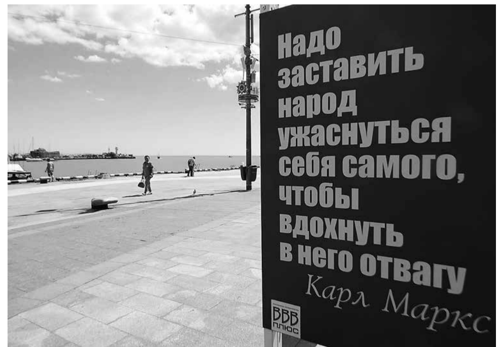
Историческая фотовыставка прошла на набережной Ялты к 100-летию Великой Октябрьской социалистической революции.