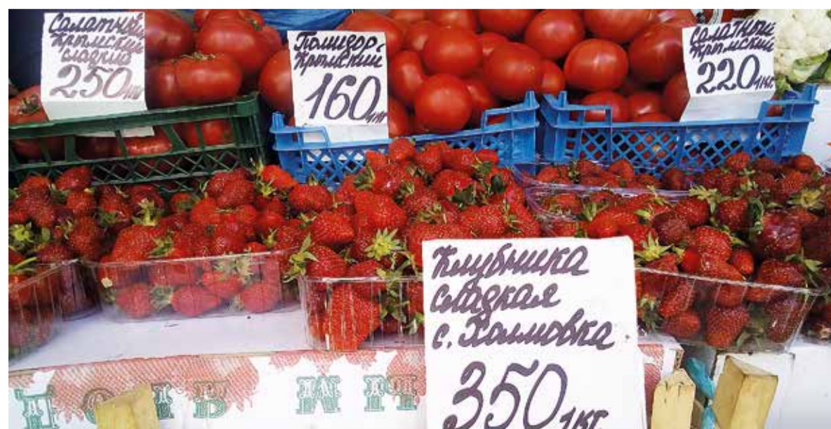
Да здравствуют бахчисарайские помидоры и клубника!